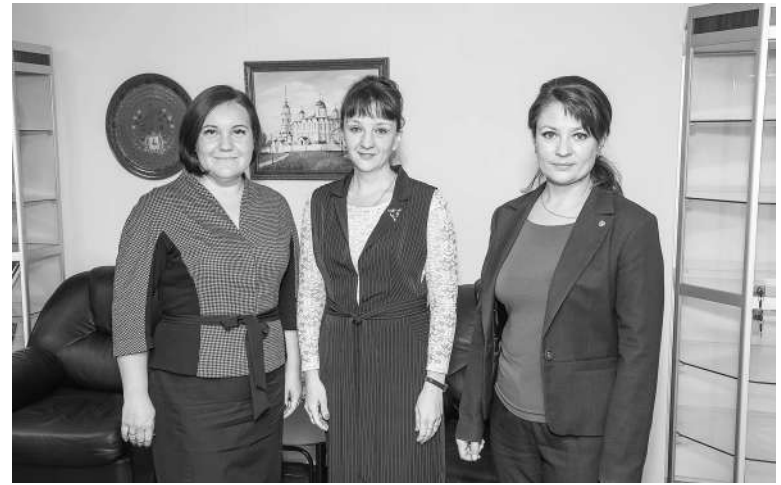
Подготовлено по материалам ЗС Владимирской области.

правам человека, Уполномоченный по правам ребенка и Уполномоченный по защите прав предпринимателей. Это небольшие по численности аппараты (сами омбудсмены и буквально несколько сотрудников). Но на них лежит огромный объем работы. Уже есть примеры того, как на основании их практики рождались нужные людям законы. Думаю, и сегодняшняя наша встреча будет иметь большое продолжение. Я считаю, мы на старте серьезного проекта, который однозначно будет полезен».